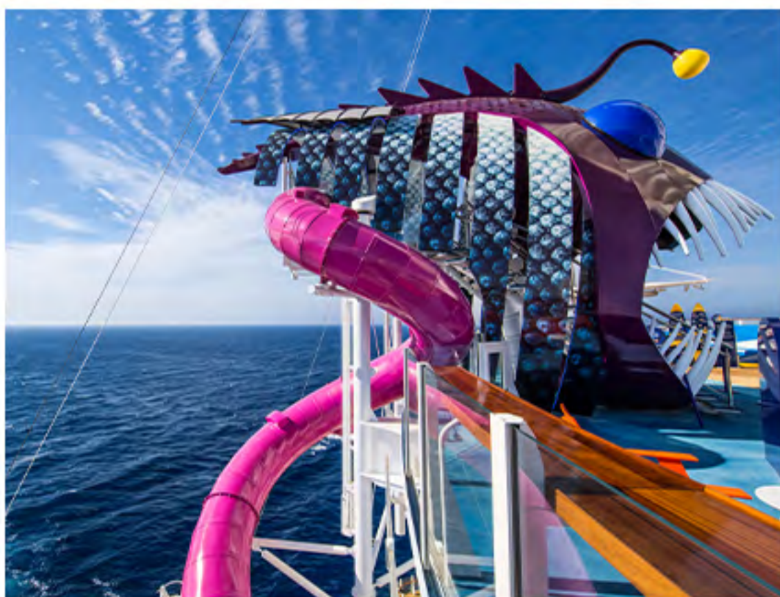
Ultimate Abyss SM